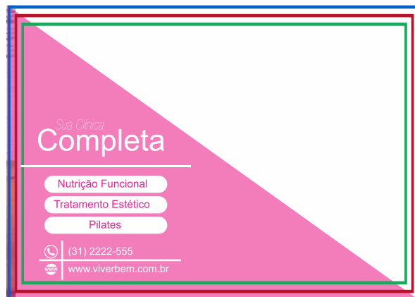
PÁGINA 02 (IMPRESSÃO VERSO)