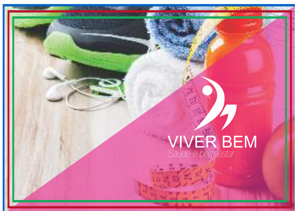
PÁGINA 01 (IMPRESSÃO FRENTE)

Veja abaixo como montar a sua arte para envio do seu arquivo